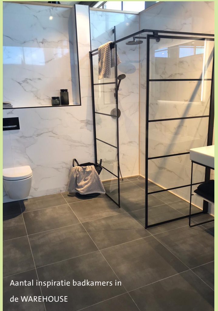
Aantal inspiratie badkamers in de WAREHOUSE