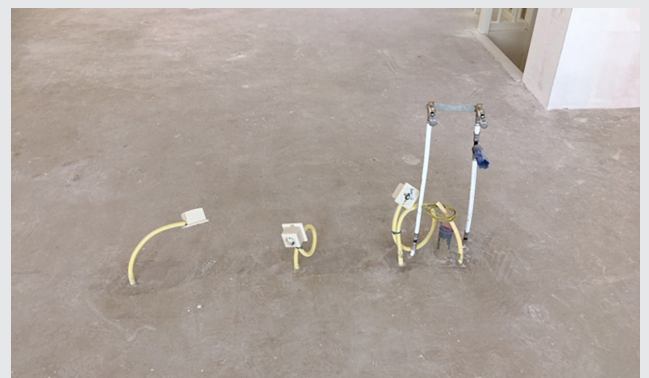
Aansluitpunten voor de keuken.