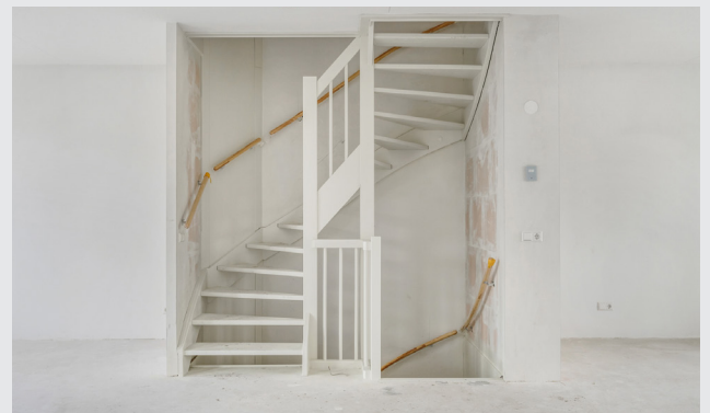
De trap kan licht beschadigd zijn door het lopen tijdens de bouw. Wij raden aan om de trap na oplevering nog te voorzien van een afwerking in de vorm van verf of bekleding.