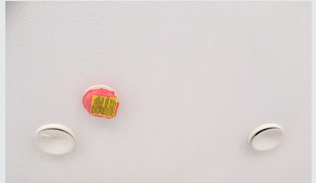
WTW ventielen en de rookmelder in het plafond.